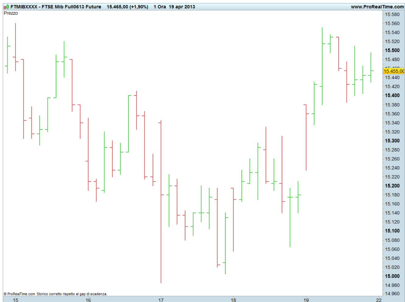
Grafico del Future Ftse Mib dal 15 al 19 Aprile 2013

Osserviamo il grafico giorno per giorno.